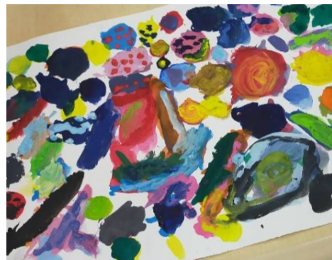
清水菜奈子さん作品